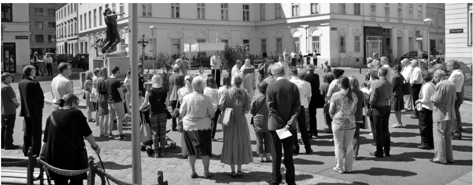
Statio am Mozartplatz 2015

Statio am Mozartplatz: Gestaltung durch Wieden - Elisabeth als Gast mit dabei