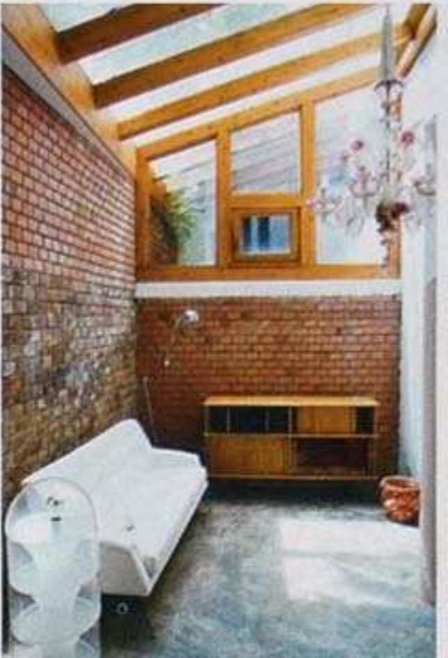
Panca da ginnastica, Repubblica Ceca, 1930. Lampade in alluminio dorato Anni 50, mensola Josita di Philipp-Markus Pernhaupt per Lichterloh. Piantana Luminator di Achille e Pier Giacomo Castiglioni, Flos (a sinistra). Uno scorcio della galleria (sopra)

Serge Mouille, Verner Panton, Charles & Ray Eames, Arne Jacobsen. E ancora Gino Sarfatti, Achille e Pier Giacomo Castiglioni, per citare solo alcune delle firme preferite dai galleristi austriaci. Per gli appassionati del design contemporaneo, oltre ai pezzi culto del Novecento, Lichterloh realizza appositamente una linea di arredi con il proprio marchio. Philipp-Markus Pernhaupt, il creativo del gruppo, è l'autore di libreria, consolle e sedute in legno e metallo laccato che citano i capolavori di Jean Prouvé e Charlotte Perriand riscuotendo perfettamente lo stile di Lichterloh. In bilico tra passione per il Novecento e gusto per la contemporaneità.