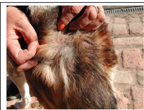
Camiro nach 1 Woche Behandlung mit NONI

Da sich Camiro wirklich soweit wundgebissen hatte, sodass bereits das rohe Fleisch hervorsah, war es wie ein Wunder, das innerhalb nur einer Woche der Rücken soweit verheilt war, sodass man schon ansatzweise wieder sein Fell nachwachsen sehen konnte.