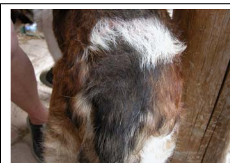
Camiro nach der Behandlung mit NONI

Was wir zusätzlich feststellen konnten, war, dass Camiro allgemein agiler wurde, er rannte wieder mit den anderen Hunden um die Wette, spielte, sprang, fraß wieder freudiger. Alles in allem war er auf einmal wieder um 2 Jahre jünger.