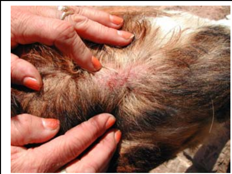
Camiro vor der Behandlung mit NONI

Da sich Camiro wirklich soweit wundgebissen hatte, sodass bereits das rohe Fleisch hervorsah, war es wie ein Wunder, das innerhalb nur einer Woche der Rücken soweit verheilt war, sodass man schon ansatzweise wieder sein Fell nachwachsen sehen konnte.