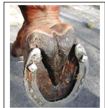
Chester nach 3 Monaten Behandlung mit NONI