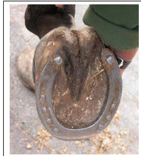
Chambory nach ca. 3 Monaten Behandlung mit NONI