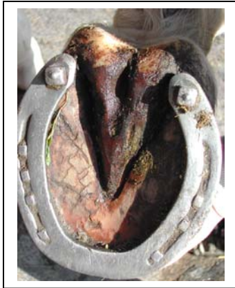
Ein gesunder Huf !

Auf diesem Bild wollen wir zeigen, wie ein ganz normaler, gesunder Huf aussehen sollte. Die Hufsohle ist glatt und rein, sie darf nicht spröde sein und vor allem der Hufstrahl ist komplett trocken und hart.