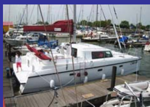
← Voyager 345 Rapier 400 ↓